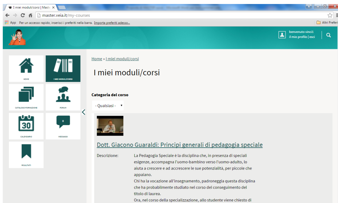
Immagine del portale di formazione a distanza della associazione ArchiBraille

La metodologia on-line, (formazione a distanza) permette di assicurare la formazione da parte di studenti-lavoratori residenti in varie regioni d'Italia e di razionalizzare l'intervento dei docenti con la possibilità di distribuire tramite il portale varie tipologie di documenti e materiali audiovisivi, di rendere la formazione accessibile nei tempi e con i ritmi legati alle esigenze dei corsisti.